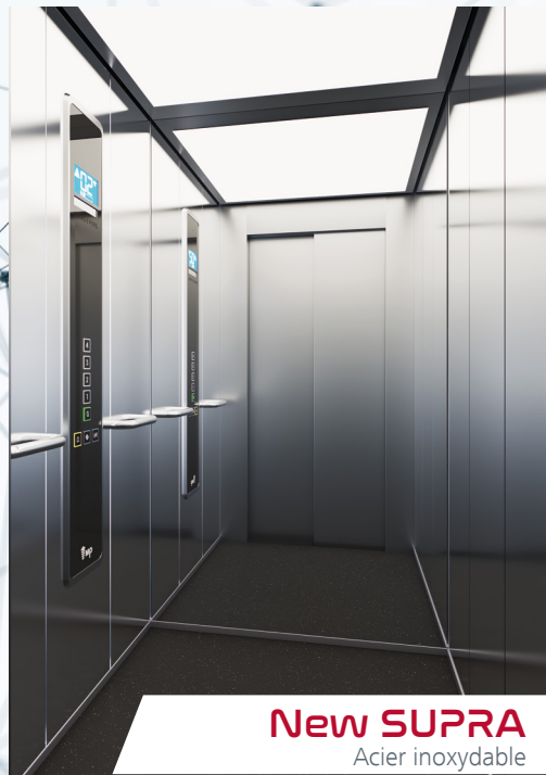
New SUPRA Acier inoxydable