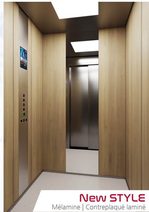
New STYLE Mélamine | Contreplaqué laminé