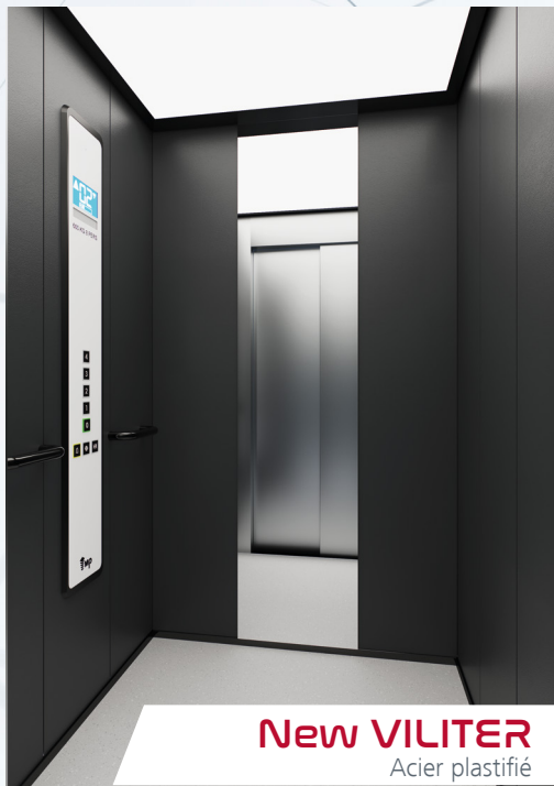
New VILITER Acier plastifié

Vous trouverez ici un aperçu de certaines de nos nouvelles cabines. Pour voir toutes les gammes disponibles, consultez notre catalogue MP CARevolution.