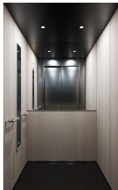
New Style Melamin | Lamierte Sperrholzplatte