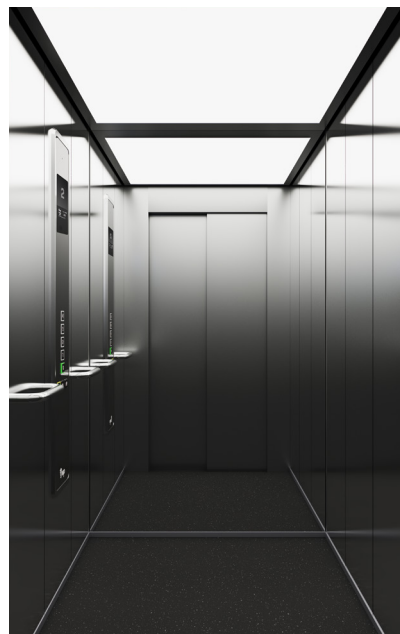
New Supra Acier inoxydable