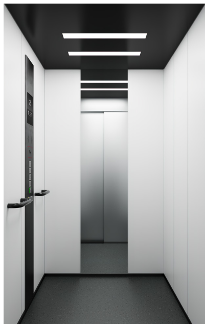
New Viliter Acier plastifié

Il ne vous reste plus qu'à sélectionner le style de cabine et à la concevoir. Vous pouvez choisir parmi de nombreuses finitions et les combiner comme vous le souhaitez.